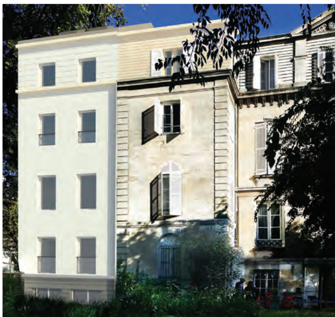
▲ Perspective du projet – Vue depuis le jardin