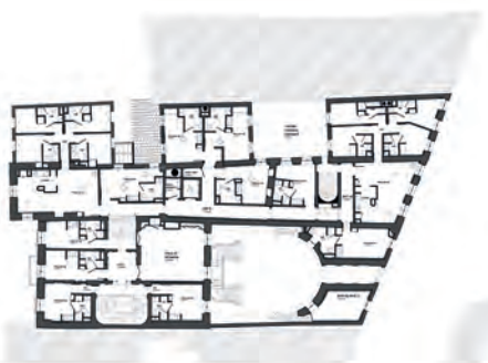
▲ Plan du 1 er étage