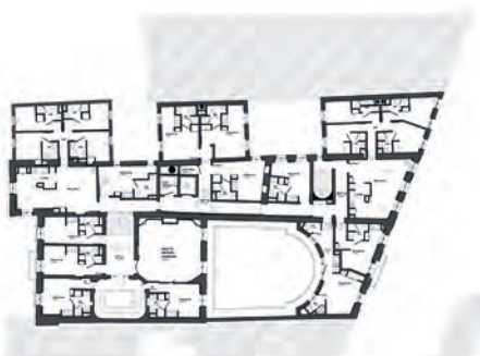
▲ Plan du 2 ème étage