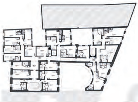
▲ Plan du 3 ème étage