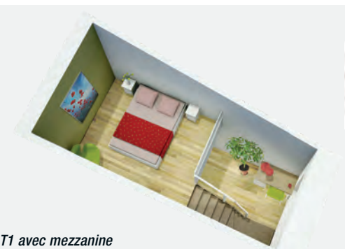
▲ T1 avec mezzanine