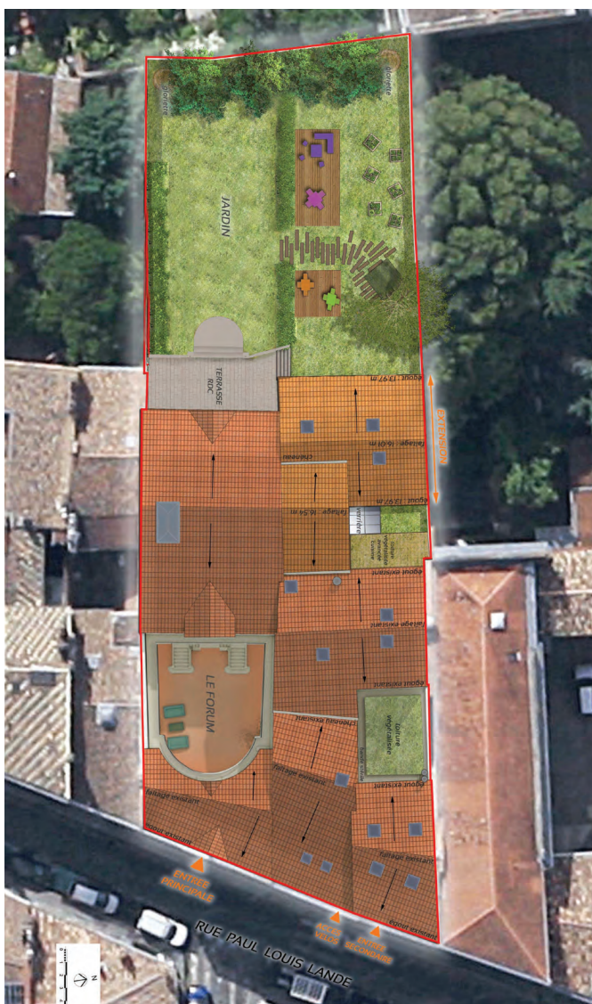
▲ Plan de masse du projet.