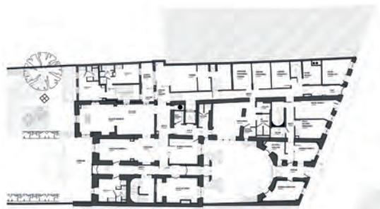
▲ Plan du rez-de-chaussée